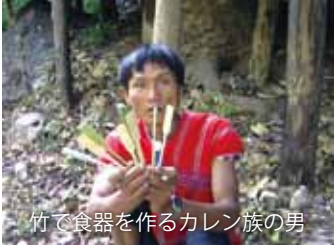
竹で食器を作るカレン族の男

北タイの山岳民族は約百万人で、カレン、モン、ラフ族など多種の民族がいます。伝統的な焼畑や狩猟を行い独自の信仰、文化などを伝承しています。彼らは国籍や土地所有の問題を抱えたまま近代化から取り残された民族ですが、艶やかな民族衣装や祭礼は、世界中の人々の関心を集めています。