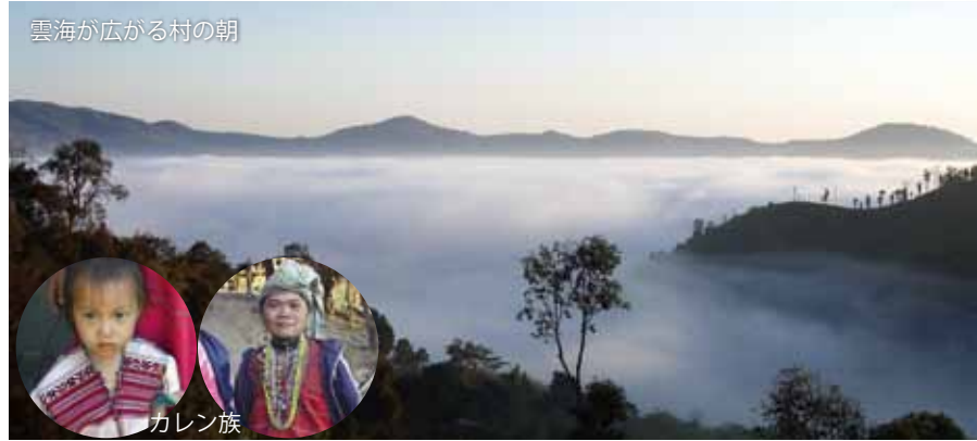
雲海が広がる村の朝