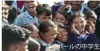
ネパールの中学生

カトマンズ近郊の学校を訪問し、元気な生徒たちと交流します。この学校は保育クラスから10年生までいます。芸術教育にも力を入れ、サバナの絵画、舞踊交流事業を共催しています。世界遺産カトマンズ盆地に古代から住み、ネパールの文化を作り上げたネワール族。古都パタンのネワール族の民家でホームステイし、彼らの日常を体験します。