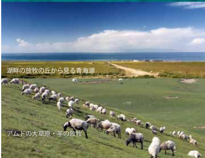
湖畔の放牧の丘から見る青海湖