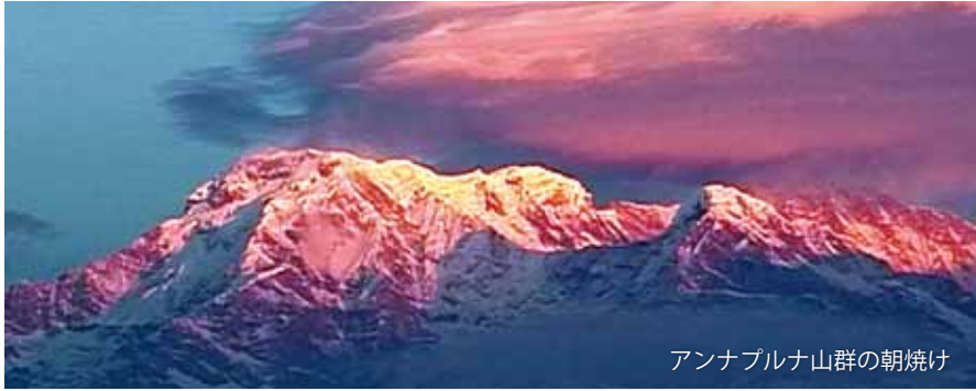
アンナプルナ山群の朝焼け

カトマンズ近郊の学校を訪問し、元気な生徒たちと交流します。この学校は保育クラスから10年生までいます。芸術教育にも力を入れ、サバナの絵画、舞踊交流事業を共催しています。世界遺産カトマンズ盆地に古代から住み、ネパールの文化を作り上げたネワール族。古都パタンのネワール族の民家でホームステイし、彼らの日常を体験します。